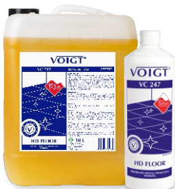
HD FLOOR VC 247 pielęgnacja i wzmocnienie powierzchni polimerowej