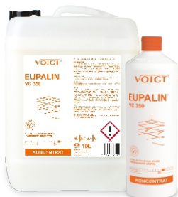
EUPALIN VC 350 pielęgnacja i wzmocnienie powierzchni polimerowej