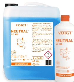
NEUTRAL VC 180 pielęgnacja powierzchni polimerowej