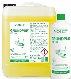
GRUNDPUR VC 150 przygotowanie podłoża